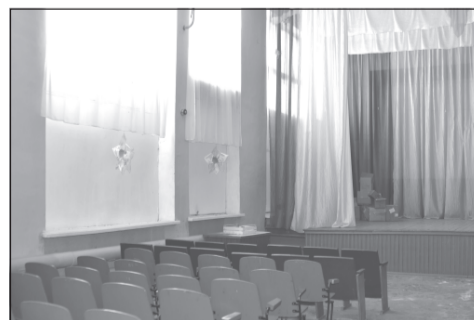
Сегодня интерьер клуба и детского сада с Толпыгино выглядит не лучшим образом, капремонт позволит обновить старые стены