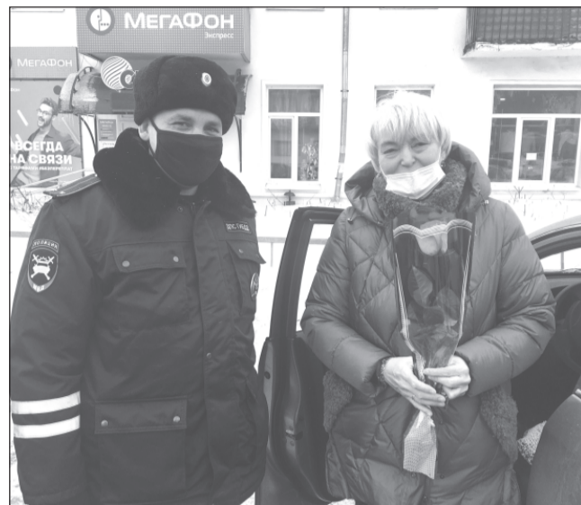
Цветы в руках строгого гаишника – приятная неожиданность

– Я подумала, что, что-то нарушила, немного занервничала, но когда меня с улыбкой поздравили с наступ-