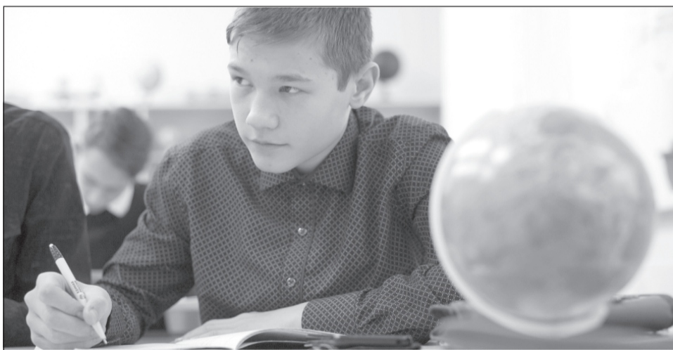
Первыми проверочные работы напишут ученики 11 классов.

Федеральная служба по надзору в сфере образования и науки утвердила расписание проведения всероссийских проверочных работ в 2021 году.