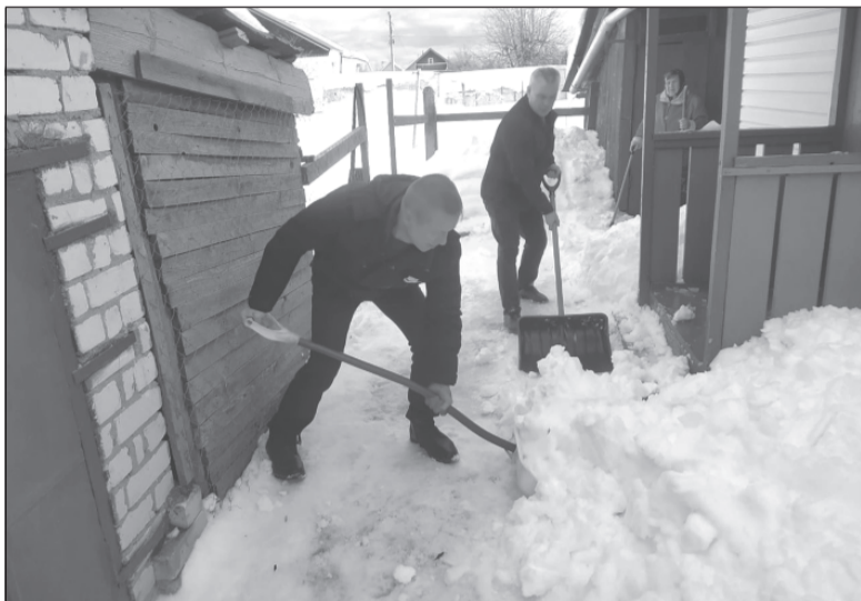
Спасибо вам, ребята, за заботу о пожилых людях

В Приволжском районе, как и в остальных муниципалитетах региона, волонтеры продолжают поддерживать граждан, нуждающихся в заботе.