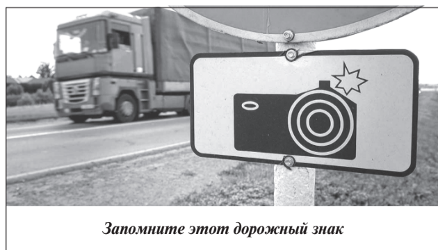
Запомните этот дорожный знак

Он предназначен для информирования водителей о том, что на данном участке может осуществляться фиксация административных правонарушений стационарными или передвижными специальными техническими средствами, работающими в автоматическом режиме и имеющими функции фото- и киносъемки, видеозаписи. В соответствии с постановлением дорожный знак устанавливается вне населенного пункта на расстоянии 150 – 300 м до зоны контроля, а в населенном пункте – со знака-