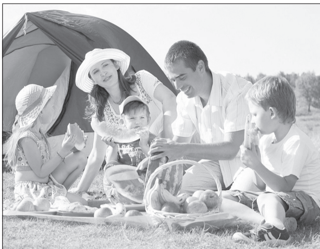
У семей с тремя и более детьми будет преимущественное право на отпуск

Госдума в третьем чтении приняла законопроект, согласно которому многодетные родители получают право на ежегодный оплачиваемый отпуск в удобное для их семей время.