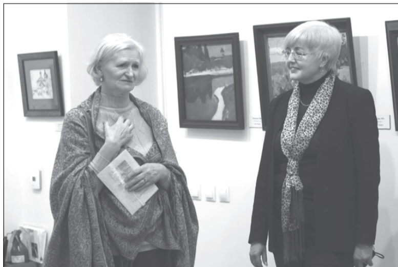
На открытии выставки

26 февраля в Музее пейзажа состоялось открытие выставки народного художника РФ, члена ВТОО «Союз художников России» Михаила Сергеевича Агеева. Все представленные картины были переданы в дар Плесскому музею-заповеднику сыновьями мастера С. М. Агеевым и И. М. Агеевым и частным коллекционером Э. Г. Донцовым.