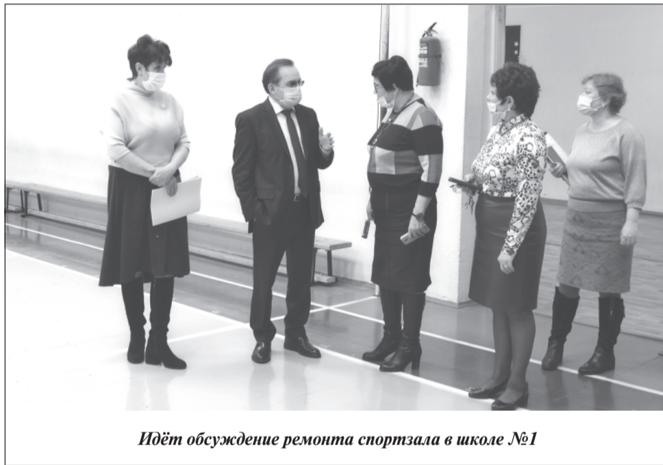
Идёт обсуждение ремонта спортзала в школе №1

В последние годы не вспомню случая, когда объекты социальной сферы городов и районов обновлялись исключительно из местных бюджетов. Все серьезные изменения финансируются либо из государственных программ, национальных проектов, либо из субсидий областного бюджета. Во многом поэтому на данном пути возникают многочисленные формальные проблемы, согласования, экспертизы. И как раз депутат областной Думы должен видеть, как сложить пазлы, чтобы в результате люди могли пользоваться современным социальным учреждением — будь то школа, клуб, либо медицинское учреждение. Я свою задачу вижу именно в этом. Поэтому приходится быть и организатором, и прорабом, и дизайнером, и финансистом. А удовлетворение приходит, когда удается сделать учреждение комфортным и полезным для людей.