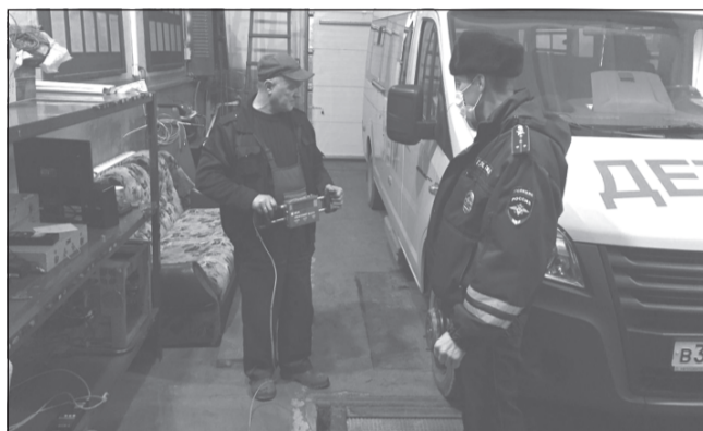
Эксплуатация транспорта, не прошедшего техосмотр, не допускается

Правительством РФ на 6 месяцев продлено действие диагностических карт о техническом осмотре транспортного средства, срок действия которых истекает в период с 1 февраля по 30 сентября 2021 года. Указанное продление не требует внесения дополнительных изменений в диагностическую карту.